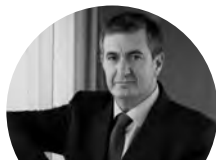
Jordi Juan LA VANGUARDIA