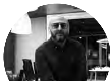
David Martínez NOBBOT.ES