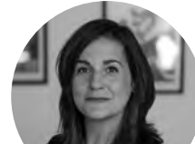
Pilar Álvarez EL PAÍS