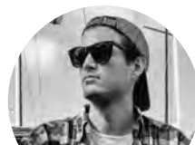
Carles Tamayo YOUTUBER