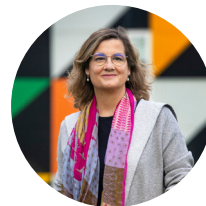
Carmela Ríos EL PAÍS