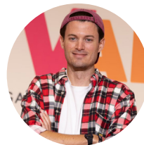
Carles Tamayo YOUTUBER