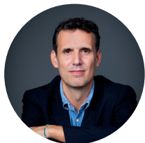
Joel Albarrán LA VANGUARDIA