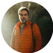
Arturo Béjar EX-DIRECTIVO DE META